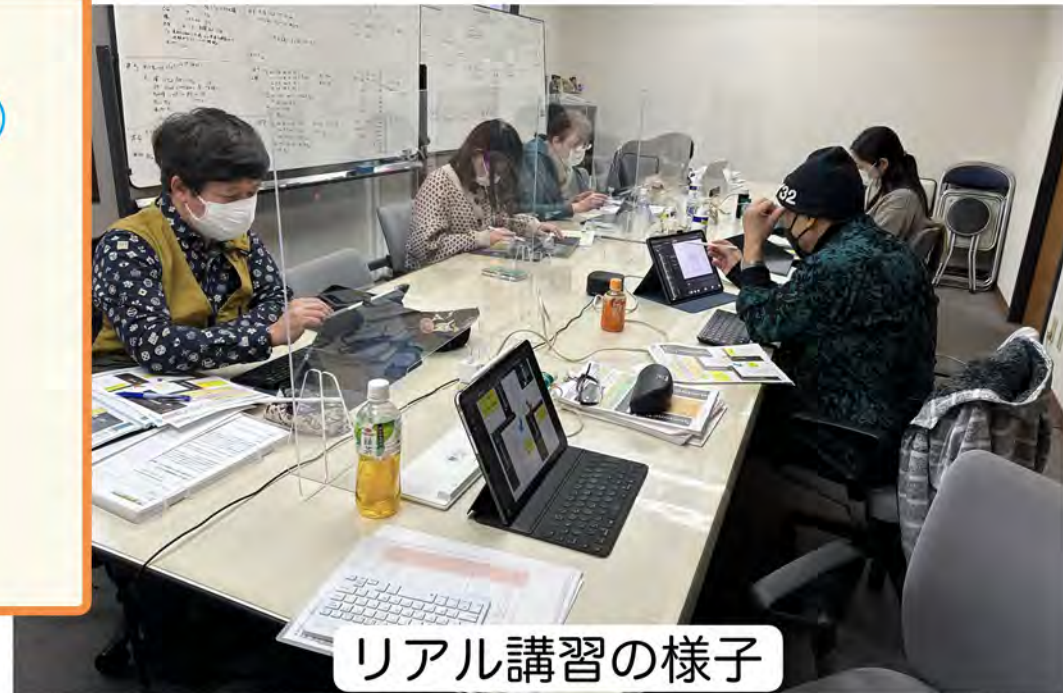
リアル講習の様子