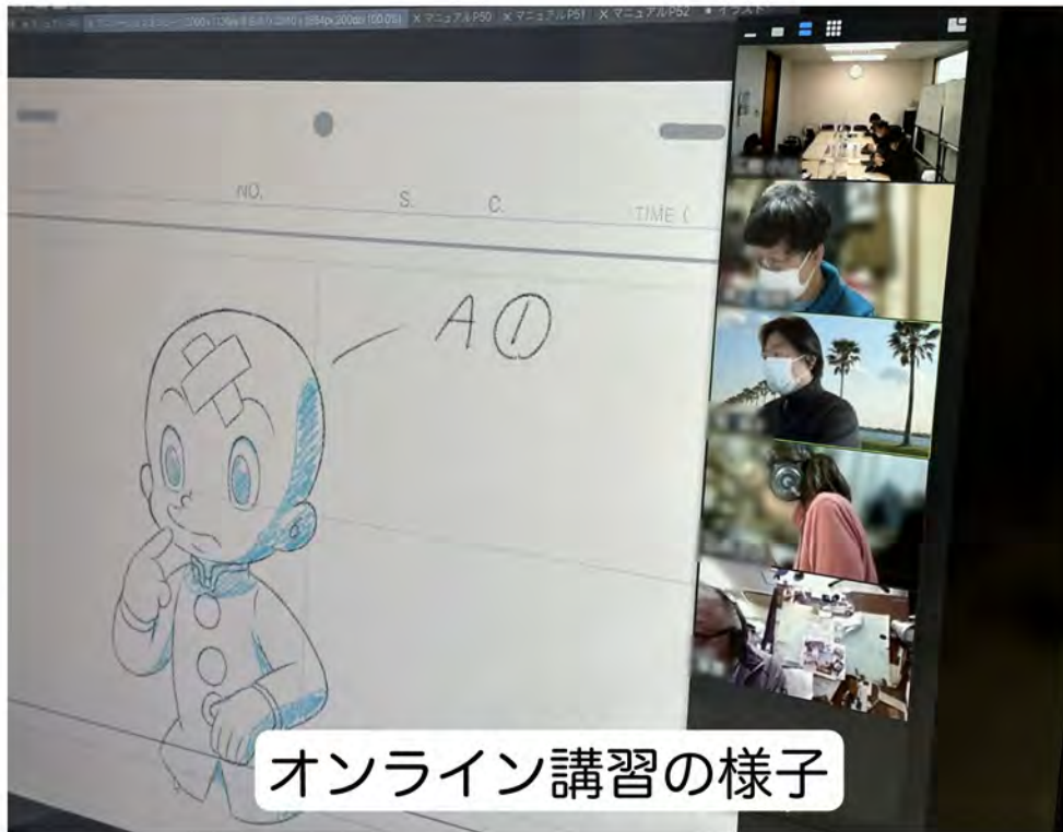
オンライン講習の様子

「講習会」は「リアル」「オンライン」どちらにも対応！ 遠隔地の方も安心して講習が受けられます！