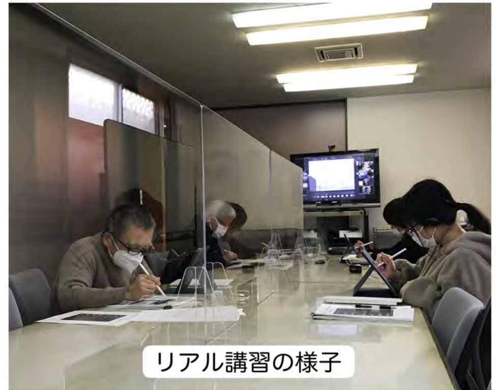
リアル講習の様子

🗨️ 講習会場は、手塚プロダクション新座スタジオ会議室(武蔵野線新座駅徒歩10分)