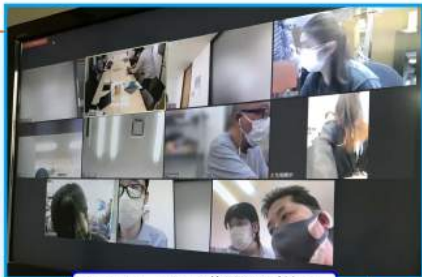
オンライン講習の様子