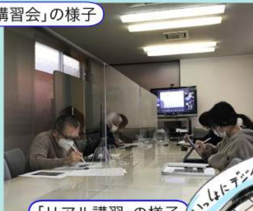
「リアル講習」の様子