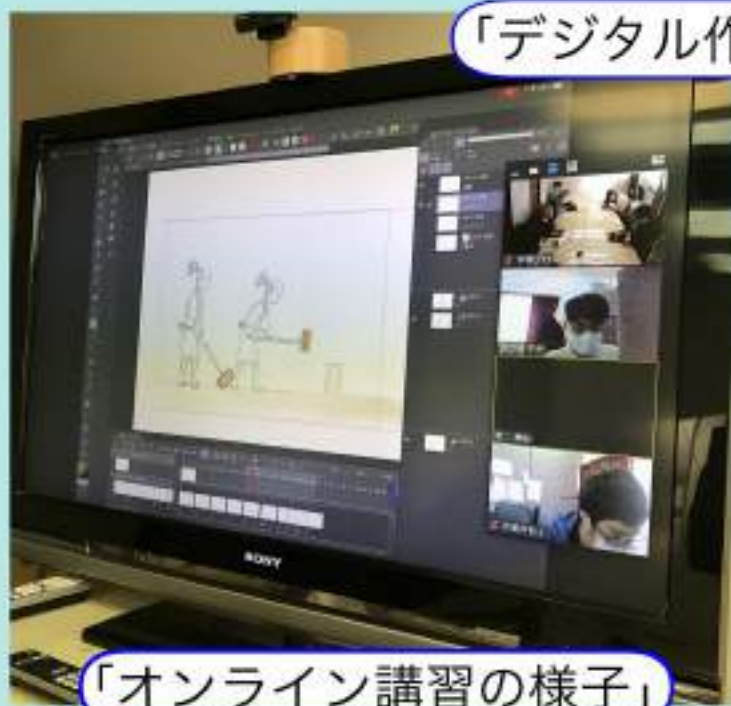
「オンライン講習の様子」